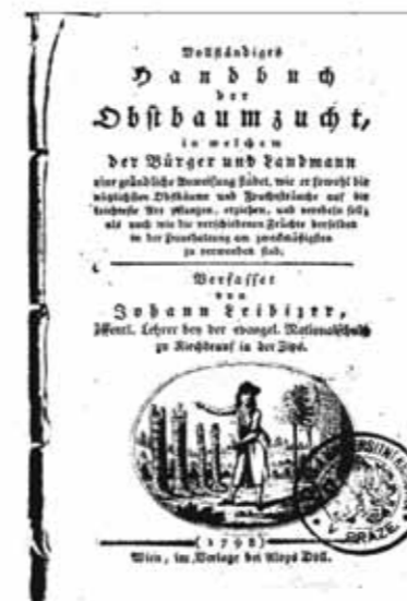
Znovu nalezený ztracený název ovocného stromu.

Při studiu zápisu v katastru obce Strážky narazil jeden náš kolega v německém soupisu ovocných stromů na jeden, ke kterému nejsme schopni najít český ekvivalent. Na prosincovém semináři (pozn. r. 2018) jsme požádali naše německé přátele o pomoc s nalezením vědeckého názvu stromu Türnickel nebo Thürnickel či dokonce Tirnickel. Podařilo se nemožné. Začátkem února se nám ozval přes SMS pán, který byl na uvedeném semináři, s informací, že se jedná o Tirnickel neboli Kornelkirsche což je latinsky Cornus mas , tedy dřín svída. Tento název je uveden