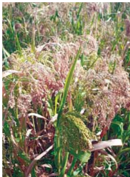
Dozrávající proso na demonstrační ploše.

Nejstarší archeologické nálezy pohanky na území České republiky pocházejí z 12. století z Opavy, Pruněvo v severních Čechách , areálu hradu Uherský Brod a Starého Jičína. To znamená, že znalost pohanky můžeme předpokládat i v mladší době hradištní (1000 až 1200 n. l.), a velmi pravděpodobně i ve střední době hradištní (800 až 1000 n. l.). Zvláště populární byla pohanka na Těšínsku, Valašsku a v Beskydech. První písemný záznam o pohance v Čechách byl nalezen v Matthioliho herbáři z roku 1596. Největší rozmach pěstování nastal zejména v 16. a v 17. století. Poté její význam postupně klesal a výrazný úpadek nastal v 19. století, což souviselo i se změnou ve složení stravy ve prospěch zvýšeného konzumu pečiva z bílé mouky. Informace o jejím pěstování jsou uvedeny v metodice z tohoto odkazu http://www.vurv.cz/files/Publications/ISBN978-80-7427-000-0.pdf .