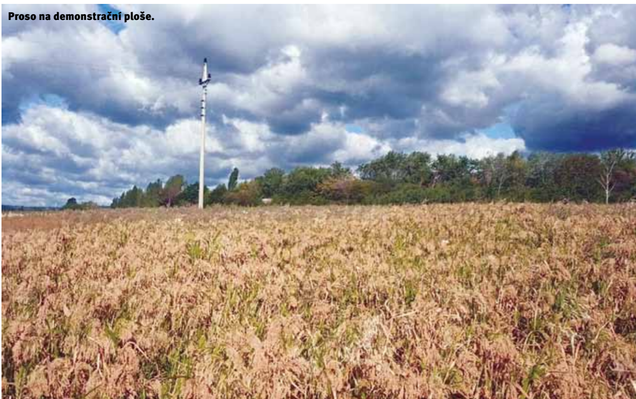
Proso na demonstrační ploše.

PĚSTOVÁNÍ PŮVODNÍCH UŽITKOVÝCH ROSTLIN REGIONU I SE ZPŮSOBEM JEJICH VYUŽITÍ DOZNA- LO VE VÍRU HISTORICKÝCH UDÁLOSTÍ NA OBOU STRANÁCH ČESKO-SASKÉ HRANICE ZNAČNÉ ÚJMY. INFORMACE O UŽITKOVÝCH ROSTLINÁCH, KTERÉ NEZMIZELY S ODSUNEM NĚMČŮ, BYLY DEFINITIVNĚ ZTRACENY PŘI KOLEKTIVIZACI ZAVEDENÍM NOVÝCH ZEMĚDĚLSKÝCH ODRŮD A SMĚRŮ. PŘESTO BYLY PŮVODNÍ UŽITKOVÉ ROSTLINY, OD NEPAMĚTI V TOMTO REGIONU PĚSTOVANÉ, PŘIZPŮSOBENY ZDEJ- ŠÍM KLIMATICKÝM PODMÍNKÁM, PŮDNÍ ÚRODNOSTI, DÉLCE VEGETAČNÍ DOBY, ZPŮSOBŮM SKLIZNĚ. REMINISCENCE PŮVODNÍCH UŽITKOVÝCH ROSTLIN A JEJICH PŘÍPADNÉ ZNOUZAVEDENÍ DO KULTURY JE ROVNĚŽ NEZANEDBATELNÝM FAKTOREM ZVYŠUJÍCÍM I REGIONÁLNÍ AGROBIODIVERZITU.