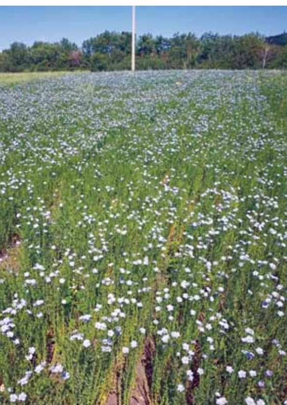
Len v květu.