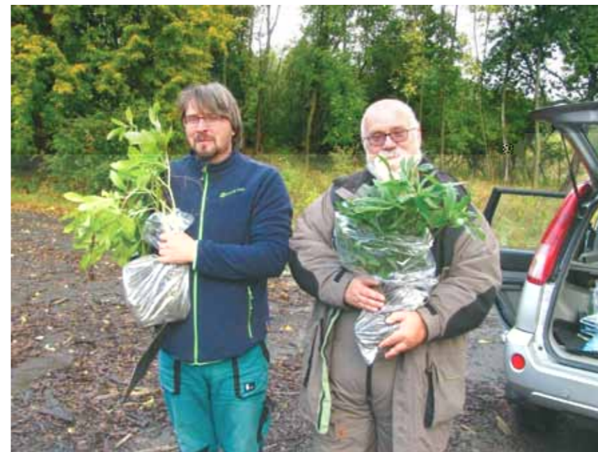
Záchranný sběr okrasných rostlin nalezených na Doupově.