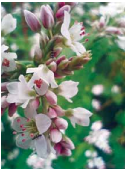
Pohanka setá - detail.

se pravděpodobně rozšířila do Bhútánu, Nepálu, severní Indie a severního Pákistánu. Přibližně ve stejnou dobu došlo k introdukcí pohanky na Korejský poloostrov a dále pak do Japonska. V Rusku byla pohanka známa zřejmě již od 10. století a odtud se šířila dále do Evropy pravděpodobně při nájezdech mongolských, tureckých a jiných vojsk, která ji využívala jako dobře skladovatelnou a snadno připravovanou stravu.