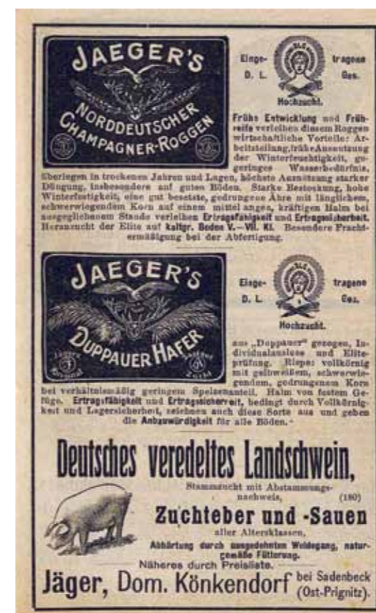
Reklama na oves vzniklý výběrem z doupovského ovsa.

Dnešní generace již nehledí na dědictví po minulých generacích jako na nepřátelskou kulturu, jako na kořist snadno získanou po původním obyvatelstvu. Silní tlak po obnově některých památek a fon- dů, turistických cest, rozhleden, výletních restaurací, studánek a pramenů, kapli a Božích muk v krajině, které bývaly její součástí. Avšak obnova krajiny nejsou jen výše uvedené nemovité památky, ale i předzahrádky s původními v regionu pěstovanými květinami či políčka s původními užitkovými rostlinami, dříve neodmyslitelně k regionu patřícími.