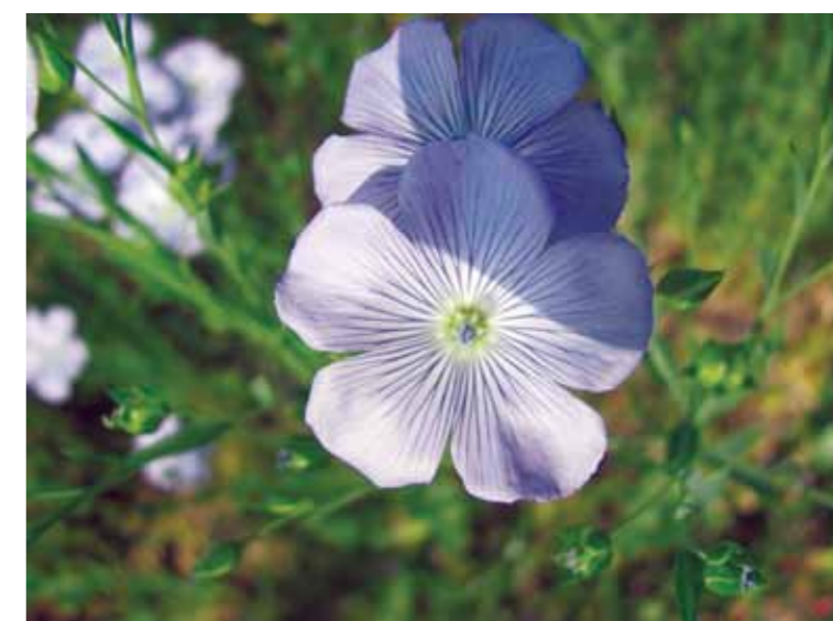
Len setý - detail květu.

Sumarizací informací o regionálních užitkových rostlinách vyjma dřevin se zabývá projekt ENZEDRA (Bílá místa rolnické historie: Původní užitkové rostliny jako cesta ke zvyšování druhové rozmanitosti regionu), který si mimo jiné klade za cíl nalezení genetických zdrojů původních, v regionu pěstovaných užitkových rostlin nebo jejich nejpodobnějších ekvivalentů. Jeho součástí je založení demonstračních políček a vytvoření jednotné genetické banky původních regionálních užitkových rostlin jakožto zdroj pro zájemce o extenzivní odrůdy a kultivary pro rozšíření druhové pestrosti a jednak jako zdroj genů pro případná další šlechtění. Nechybí ani příprava výukových a informačních karet o regionálních užitkových rostlinách pro žáky mateřských, základních a středních škol, ale rovněž laickou a odbornou