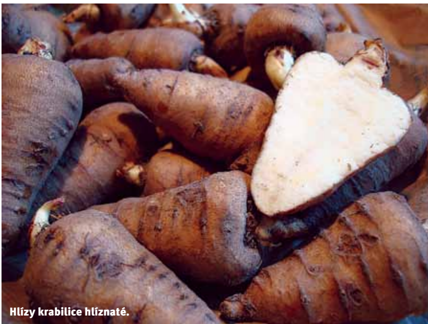
Hlízy krabilice hlíznaté.

ských a horských oblastech. Jeho lidový název byl kvak nebo kvaka a v dobách hladomoru se vařený přidával do chlebového těsta. Tuřín zde byl důležitou okopaninou až do konce 18. století, kdy začalo na významu nabývat pěstování brambor. Přesto však v letech 1923 - 1925 zaujímal tuřín na území Československa výměru 25 000 ha. Před druhou světovou válkou se tato plocha snížila na 8000 ha. Do roku 1938 se tuřín nejvíce pěstoval v horním Poohří a na Českomoravské vysočině, zejména však jako krnná plodina.